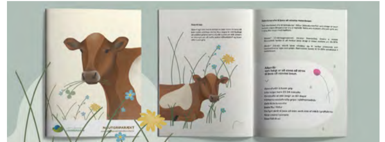
Í bæklingnum um nautgriparækt er áhersla á metanið sem myndast við iðragerjun gripanna. Myndræn framsetning á hringrás metans frá nautgripum, ásamt lýsingu á góðum búskaparháttum sem leiða til minni metanlosunar, eru í forgrunni. Í lok bæklingins eru teknar saman aðgerðir sem nautgripabændur geta byrjað strax að vinna að og leiða til minni losunar metans.