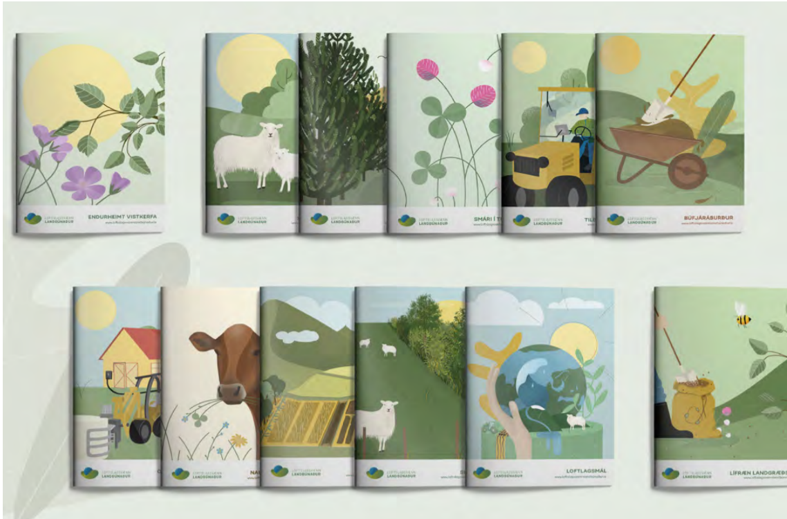
Bæklingarnir tólf fjalla um búfjáráburð, smára í túnrækt, nautgriparækt, skógrækt, loftslagsmál, orku í landbúnaði, endurheimt vistkerfa, jarðrækt, lífræna landgræðslu, sauðfjárrækt, skjólbelti og tilbúinn áburð.