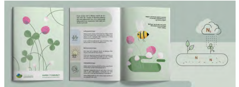
Í bæklingnum um smára í túnrækt er fjallað vítt og breitt um ræktun smára í túnum. Smári minnkar þörf fyrir tilbúinn áburð við túnrækt þar sem í rótarhnyðum hans eru bakteríur sem binda köfnunarefni (N) úr andrúmsloftinu og það nýtist sem áburður fyrir túnin.